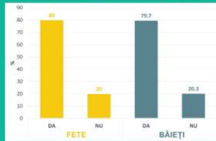
Distribuția procentuală a respondenților elevi de liceu în funcție de gen și experimentarea noilor produse din tutun