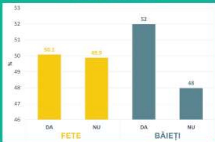
Distribuția procentuală a respondenților elevi de liceu în funcție de fumatul frecvent și gen